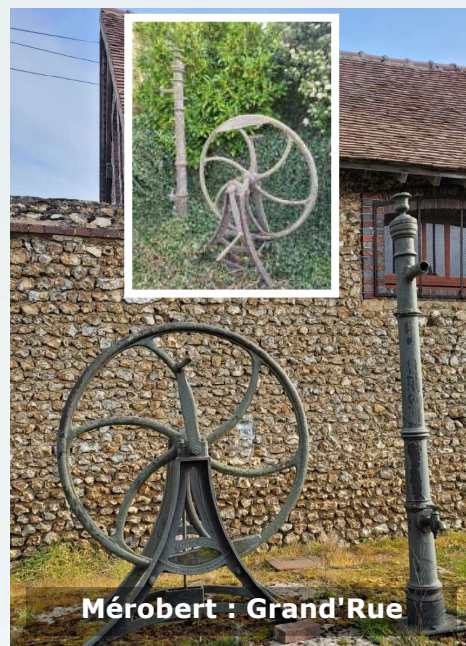
Méroberty : Grand'Rue

Sur les seize pompes publiques initialement installées, seules neuf d'entre-elles demeurent aujourd'hui encore visibles : sept à roue et deux à balancier.