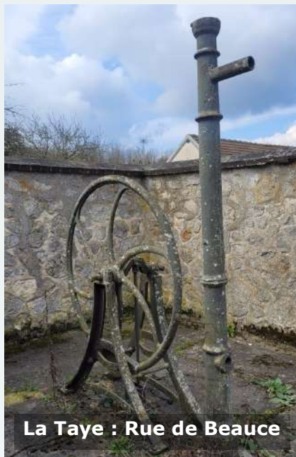
La Taye : Rue de Beauce