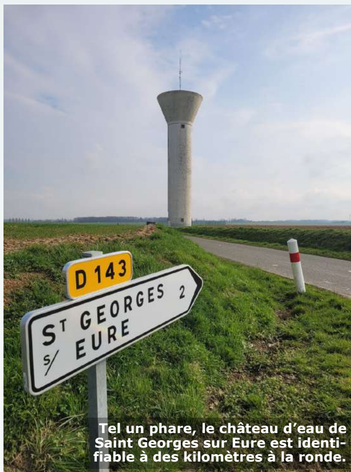
Tel un phare, le château d'eau de Saint Georges sur Eure est identifiable à des kilomètres à la ronde.

Aujourd'hui, c'est Chartres métropole, via la société « Cm eau », qui gère la distribution d'eau potable dans notre commune. L'eau provient de plusieurs points de captage, dont celui de Mérobert, afin d'apporter une eau de bonne qualité à la population.