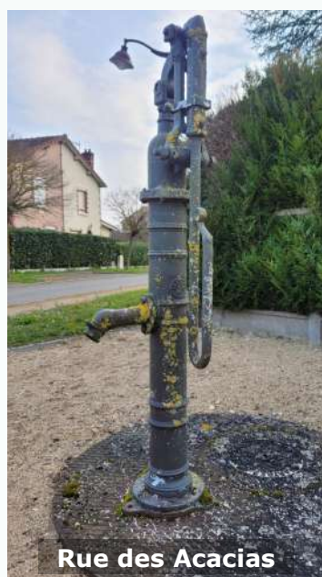
Rue des Acacias