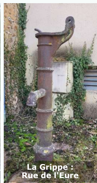
La Grippe : Rue de l'Eure