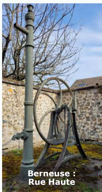
Berneuse : Rue Haute