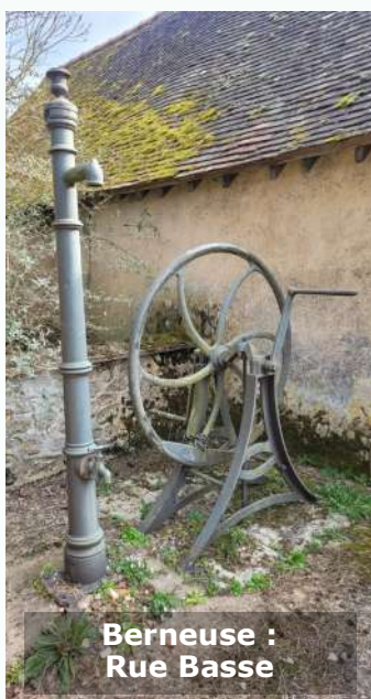
Berneuse : Rue Basse