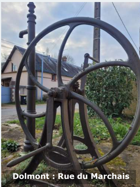
Dolmont : Rue du Marchais