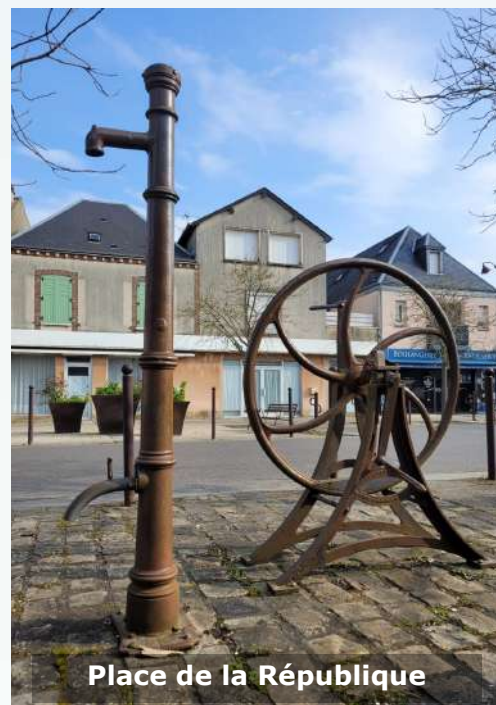
Place de la République

Les pompes aujourd'hui disparues étaient situées rue Maurice Dumais (aux alentours de l'actuel n°36), rue du Général de Gaulle (à l'emplacement de l'actuel n° 14), rue Jean Moulin (entre le monument aux morts et l'école), rue de la Plaine à Dolmont et au début de la rue Pierre et Marie Curie.